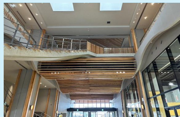
1階 吹抜 完成状況