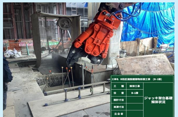
ジャッキ架台基礎 解体状況