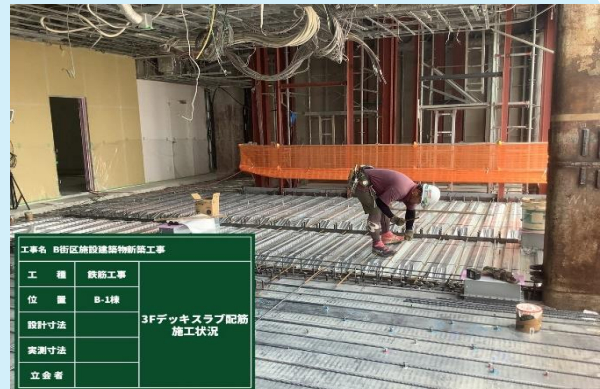
3階 デッキスラブ配筋状況