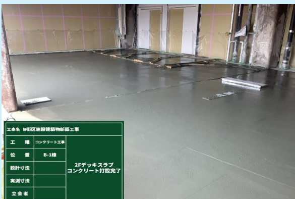
2階 スラブコンクリート打設完了状況